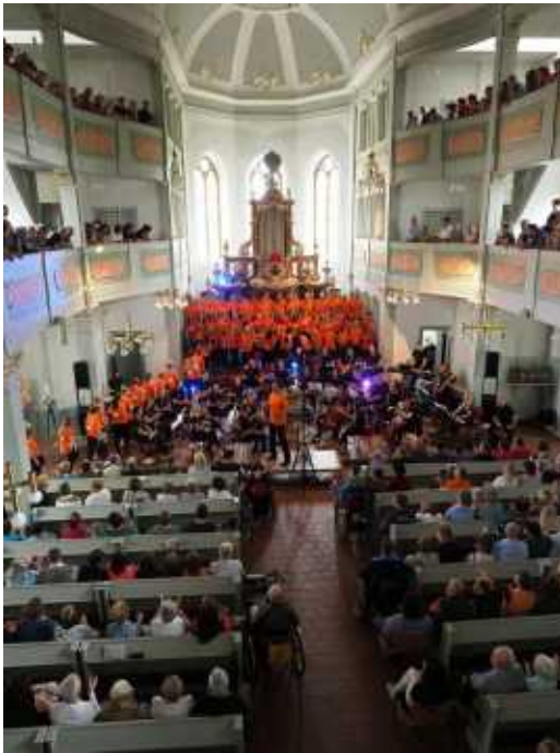
oben:  rechts